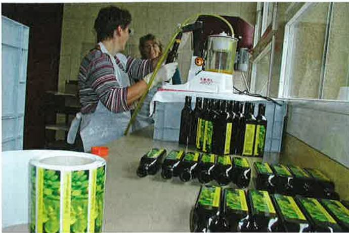
Für das Abfüllen des in Flawil gepressten Rapsöls sind die Bauersfrauen der Region zuständig.