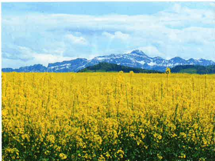
Rapsfelder im Fürstenland liefern den Rohstoff des Öls, aus der die Mayonnaise hergestellt wird.

lem Produkt begeistern, machte sich sogleich an die Rezeptur für eine Mayonnaise, die auf eben diesem Öl beruht, und suchte nach einem Betrieb, der die Mayonnaise produzieren und marktkonform in Tuben abfüllen konnte. Fündig wurde er in Basel. Gerne hätte Hangartner mit einem Ostschweizer Betrieb zusammengearbeitet. Mit Blick auf die Richtlinien im Bereich Hygiene kam jedoch nur ein absoluter Profi auf dem Gebiet der Mayonnaiseherstellung infrage. Kommt hinzu, dass sich daraus auch Synergien beim Abfüllen ergeben. «Unser Ziel ist es, die Mayonnaise möglichst breit zu streuen. Und dafür taugt einzig die Tube», hält der Küchenchef fest.